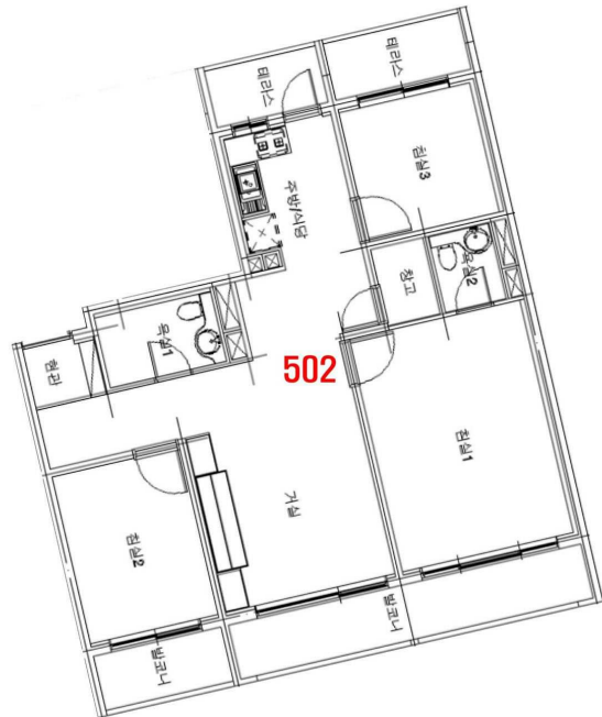
< 내부구조도 >