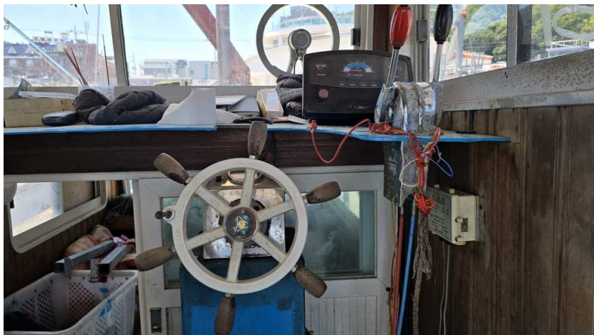
기호2) 조타기 및 선회창 등