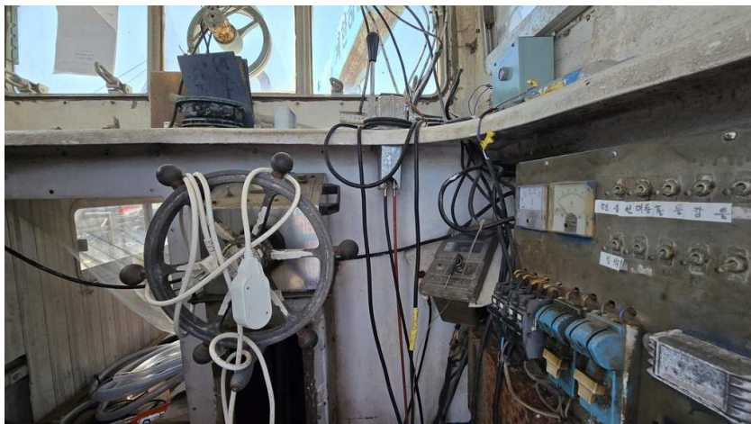
기호1) 조타기 및 선회창 등