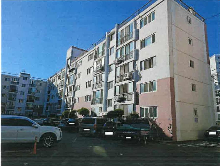
본건 소재 제나동 남동측 근경