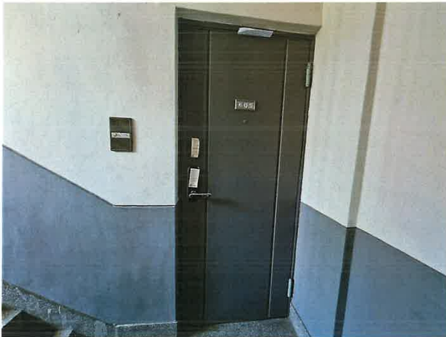
본건 출입 현관문