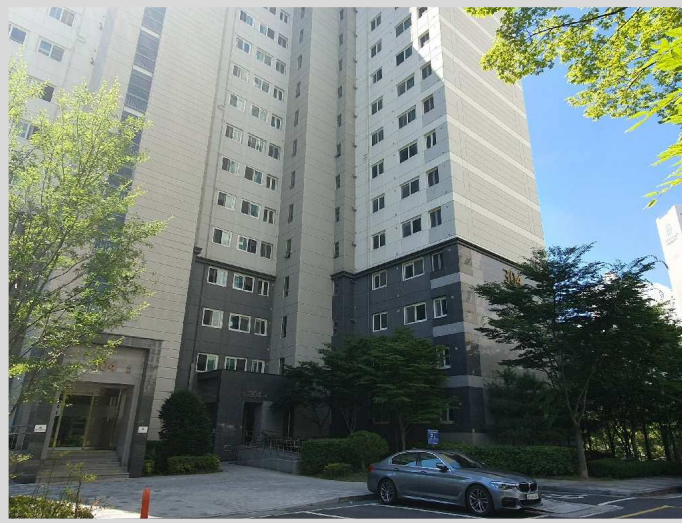
본건 북측 전경