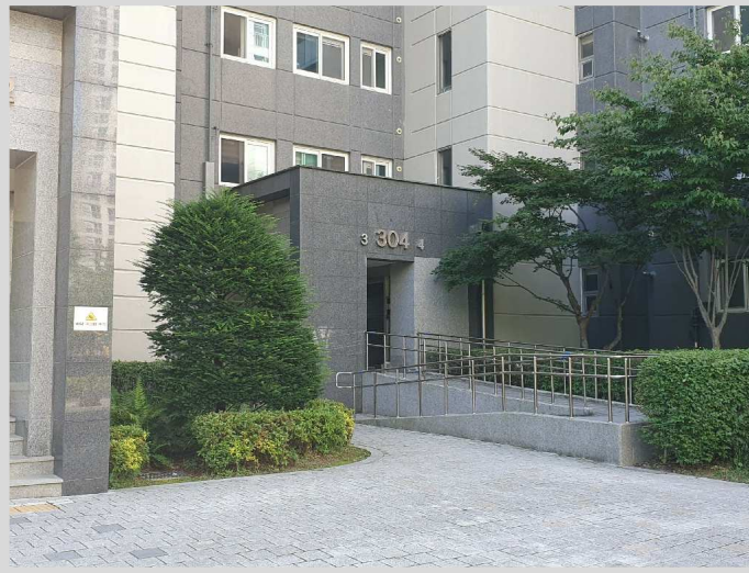
104동 3,4호라인 출입구