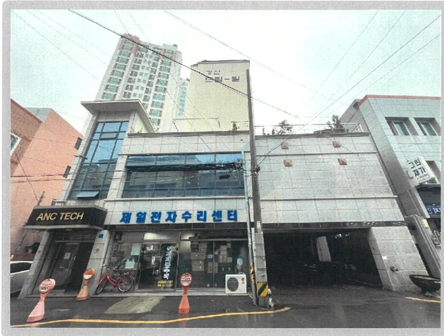
【 대상물건 전경 】