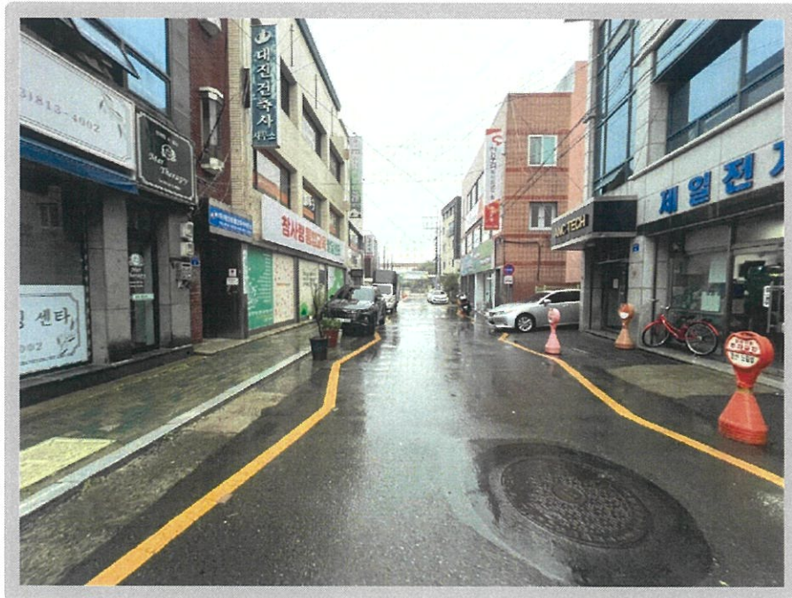
【 대상물건 인접도로 전경 】