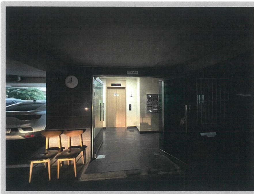
【 대상물건 전경 】