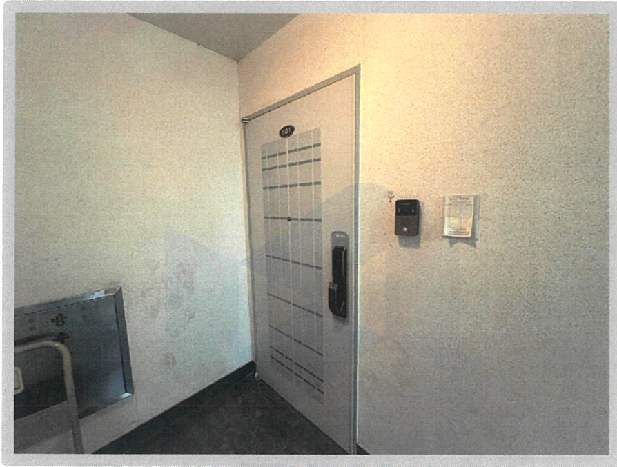
【 대상물건 전경 】