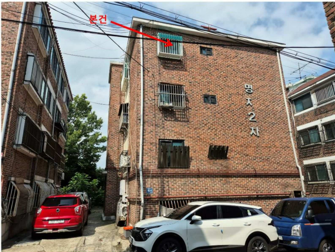
남측에서 촬영한 본건 건물 전경