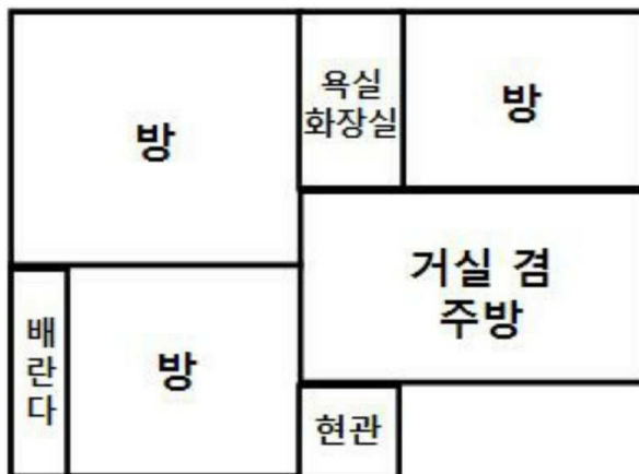
명지주택 제3층 제302호