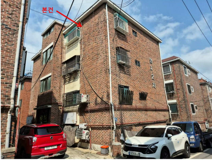
서측에서 촬영한 본건 건물 전경