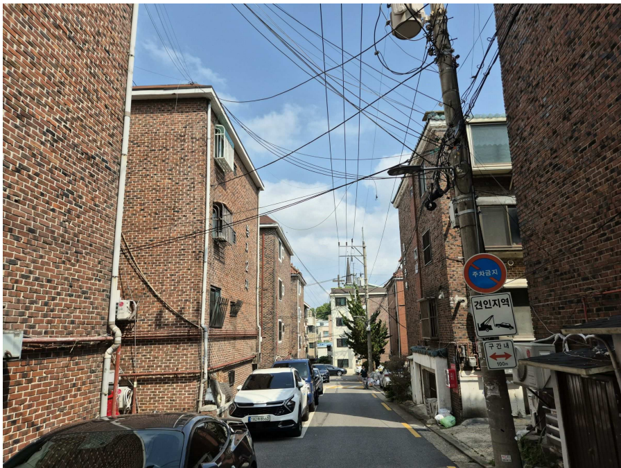
본건 전면도로 및 주위환경