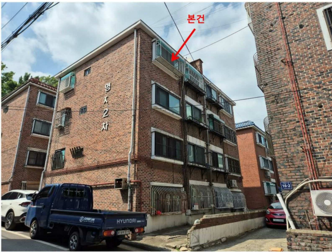
동측에서 촬영한 본건 건물 전경