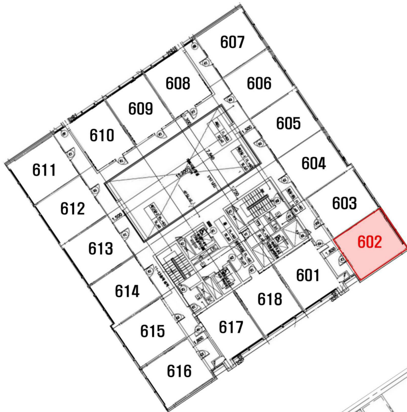
< 호별배치도 >