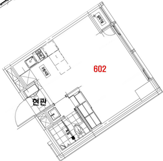
< 내부구조도 >