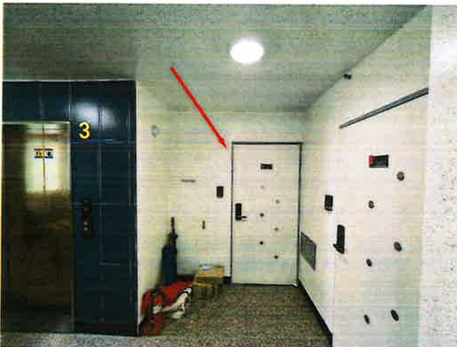
본건 복도 및 현관 전경