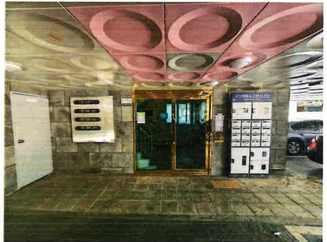
본건 공동현관 출입구 전경