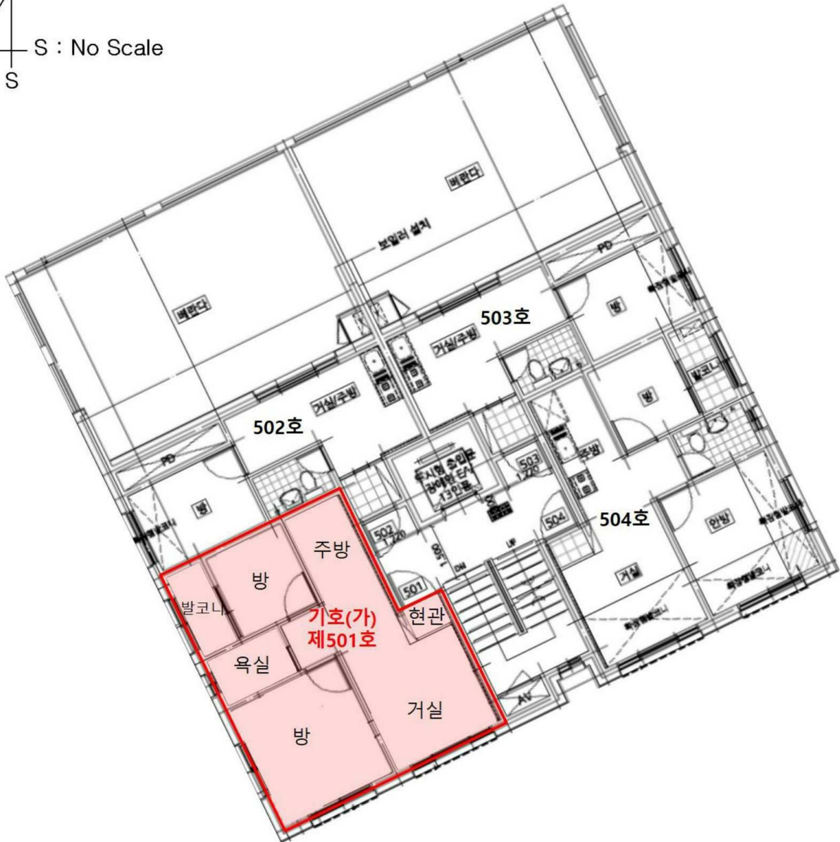
< 제5층 호별배치도 및 내부구조도 >