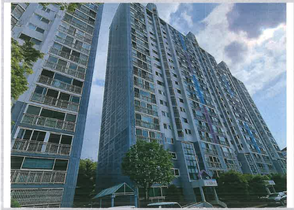
본건 소재 동 전경(북동측에서 촬영)