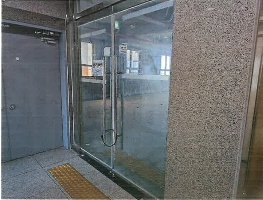
본건 기호 1)