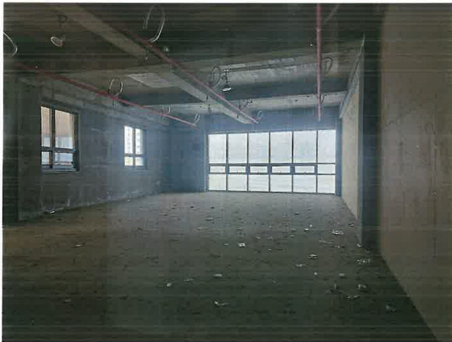
본건 기호 1) 내부