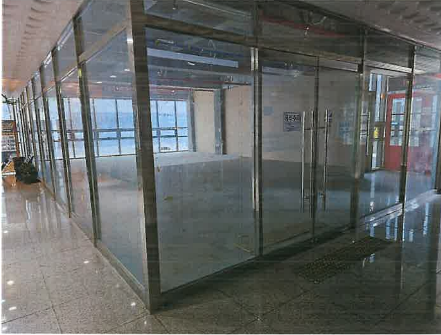
본건 기호 2)