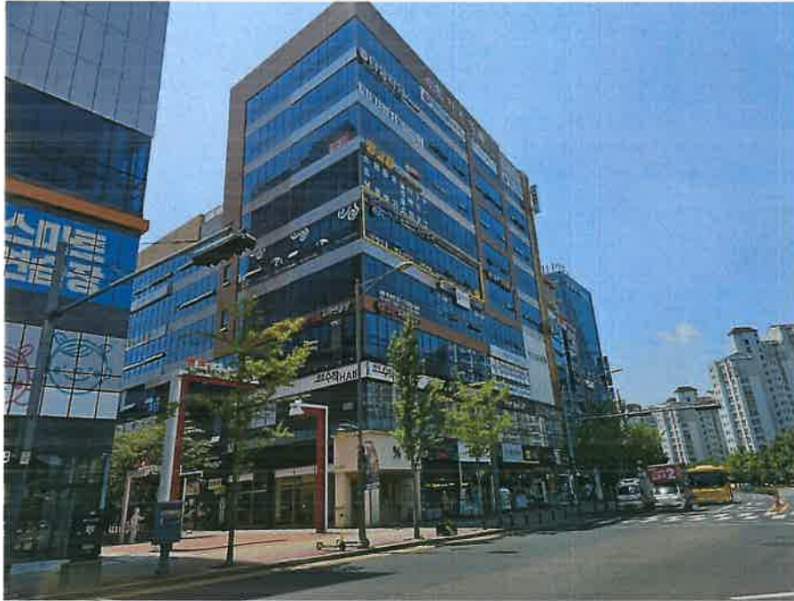
본건 소재 건물 북동측 전경