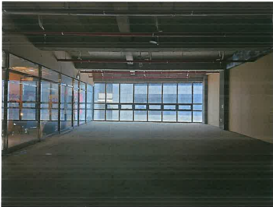
본건 기호 2) 내부