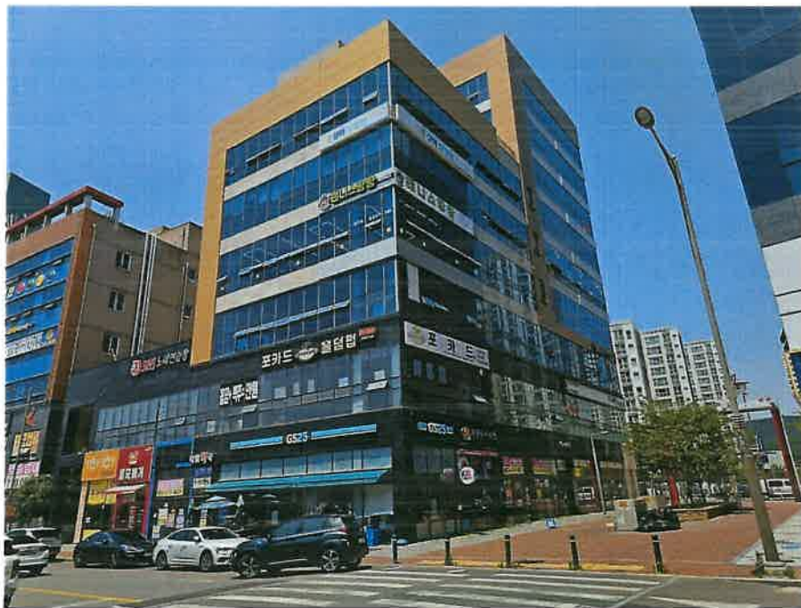
본건 소재 건물 남동측 전경