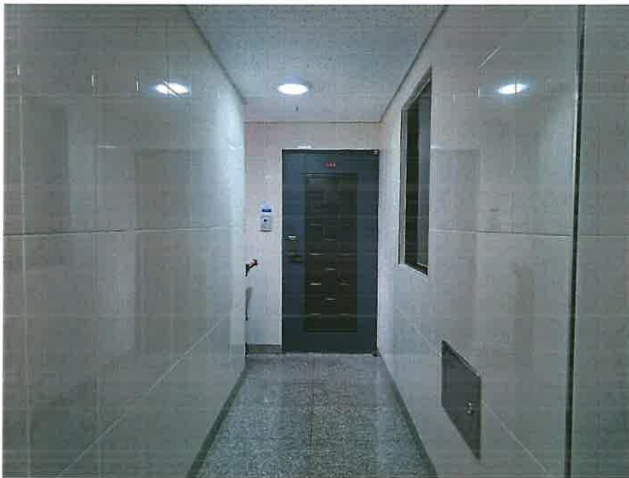
본건 현관 출입문