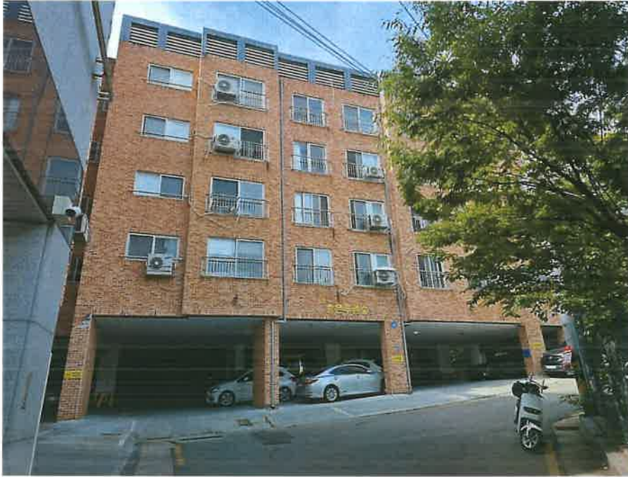
본건 소재 '송은푸른숲' 남측 근경