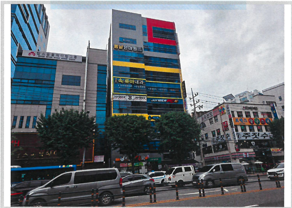
본건 전경(북측에서 촬영)