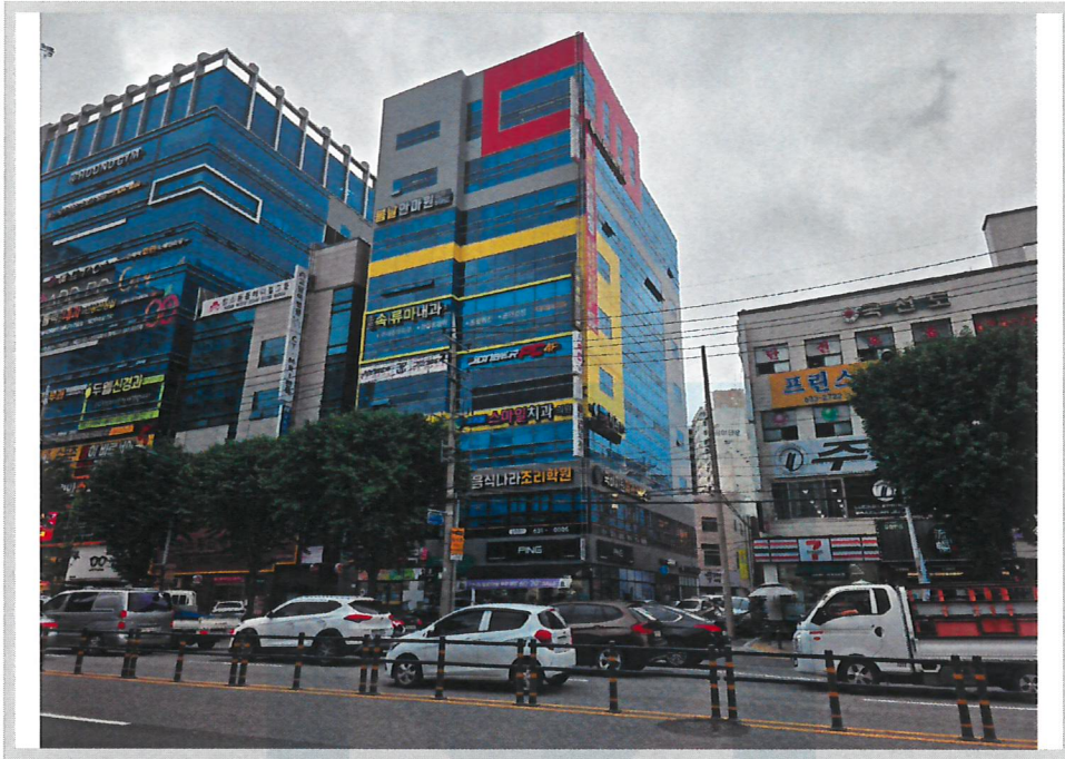
본건 전경(북서측에서 촬영)