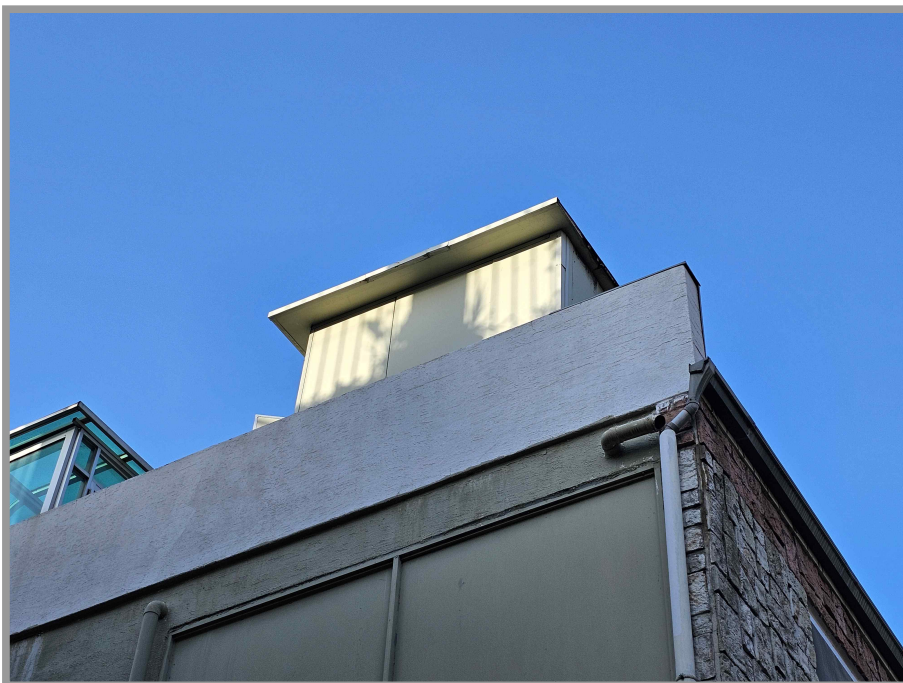
【 제시외 건물 ㄷ ) 】