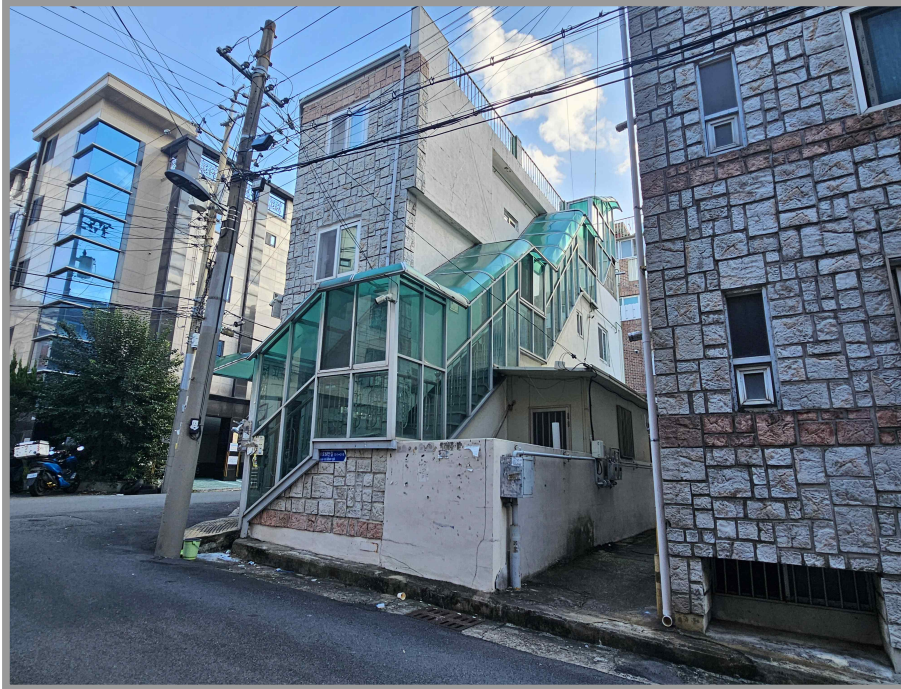
【 본 건 】