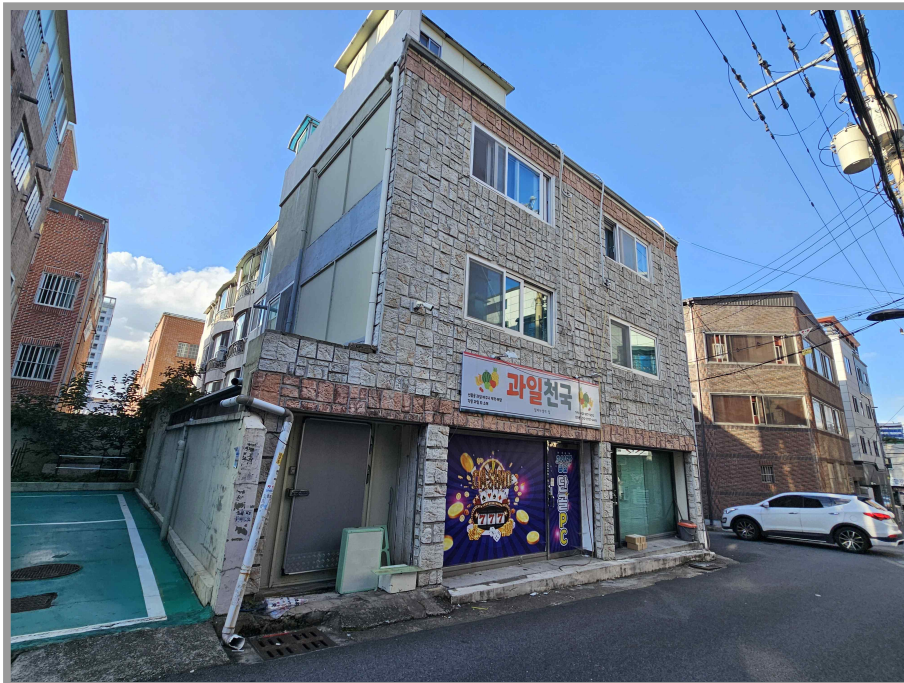
【 본 건 】