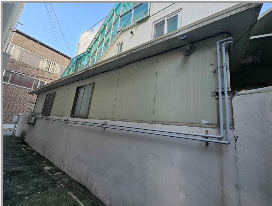
【 제시외 건물 ㄱ ) 】