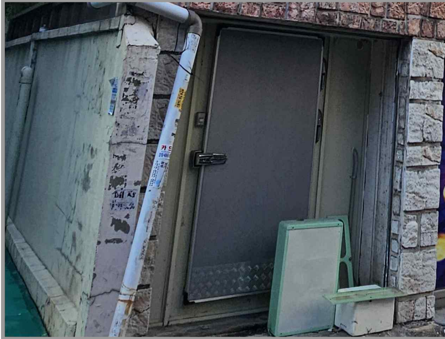
【 제시외 건물 ㄴ ) 】