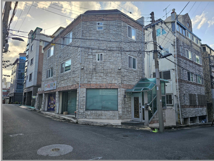
【 본 건 】