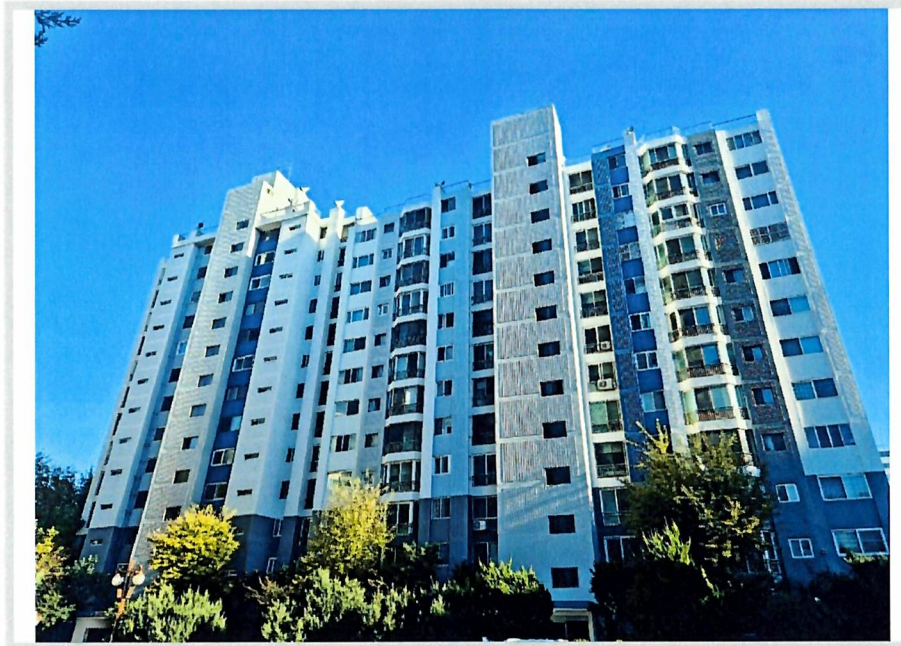
본건동 전경(북서측에서 촬영)