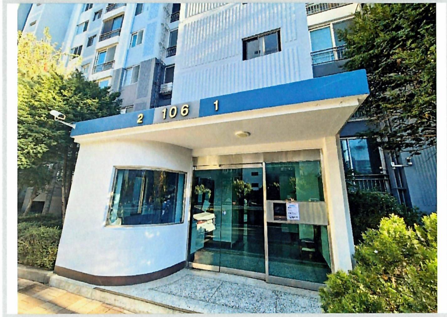
1층 공동 출입구