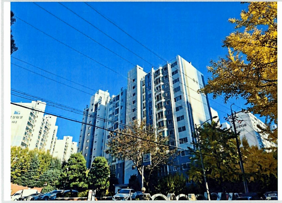
본건동 전경(서측에서 촬영)