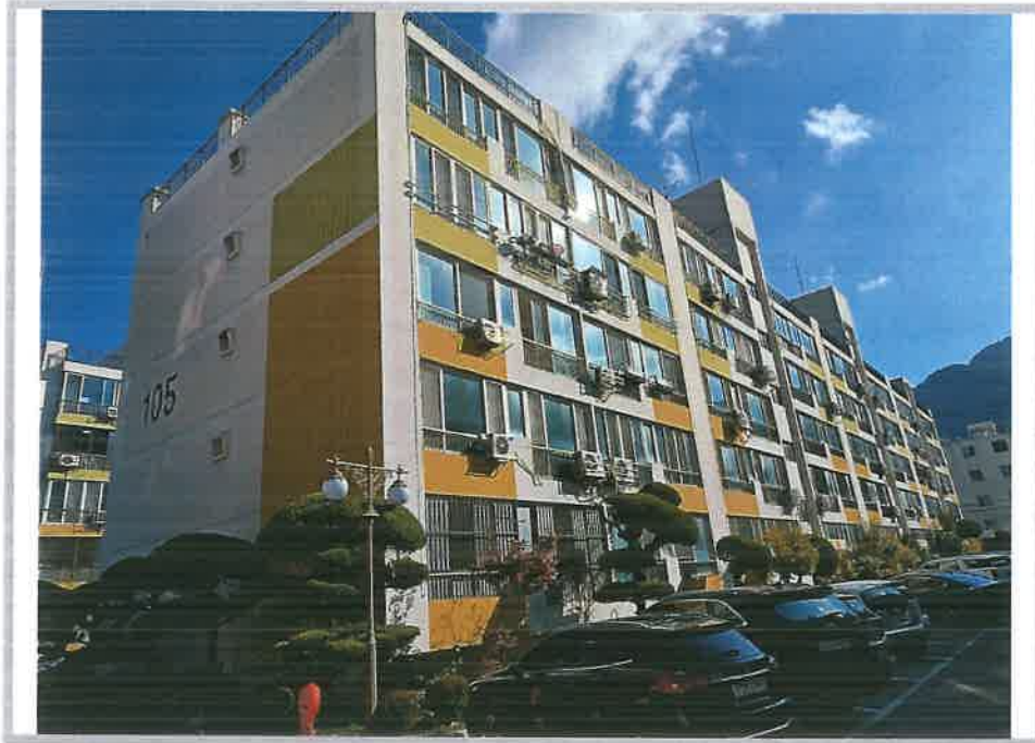
본건 소재 5동 전경(북서측에서 촬영)