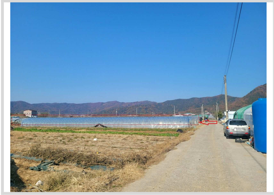
본건 및 주변전경 (남측 인근에서 촬영)