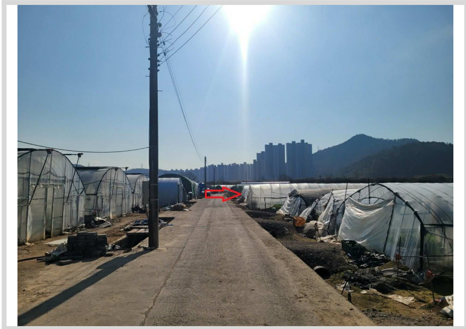
본건 및 주변전경 (동측 도로 북측에서 촬영)