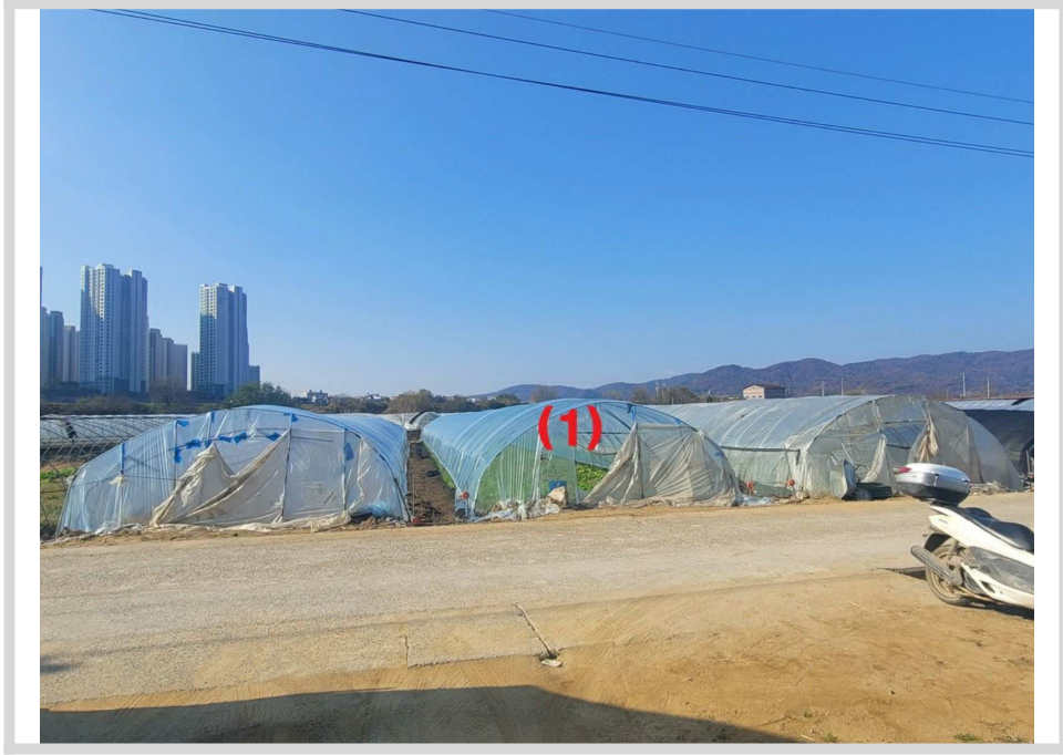
본건전경 (동측에서 촬영)