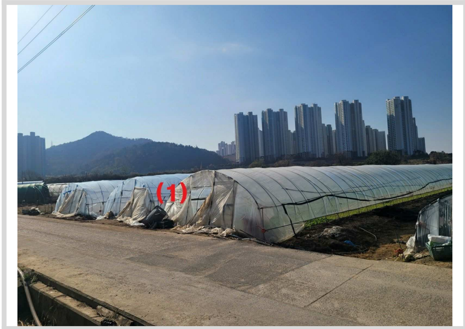
본건전경 (북동측에서 촬영)