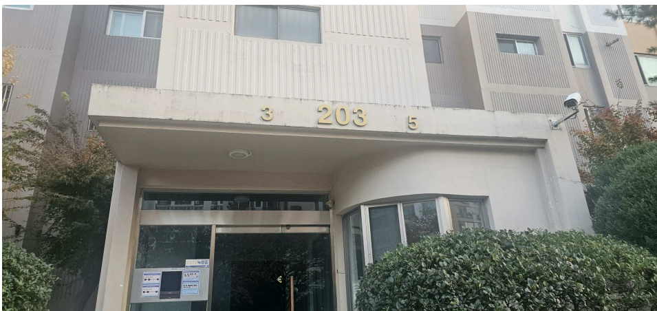
본건 출입구 전경