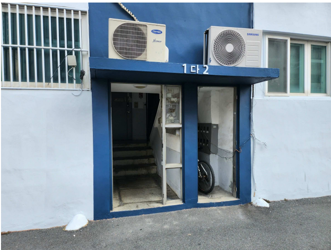
1층 입구 전경