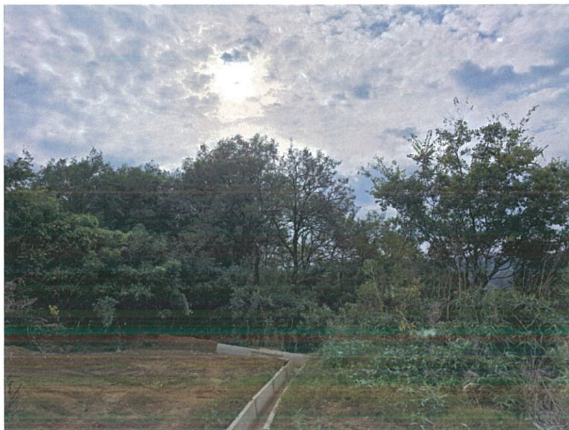
【 본건 북서측 전경 】