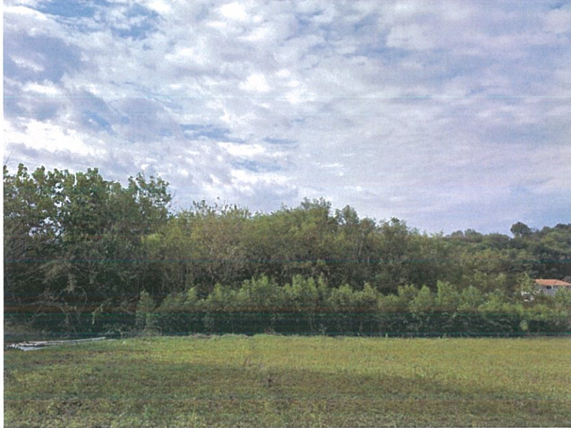
【 본건 북동측 전경 】