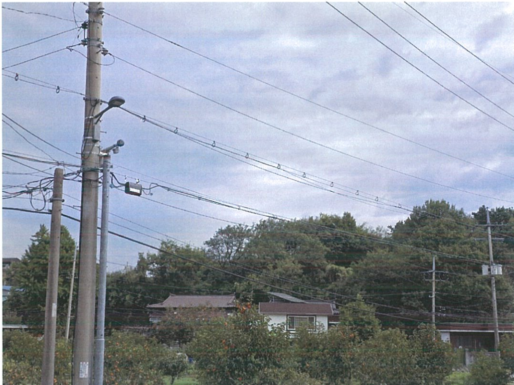
【 본건 서측 원경 】