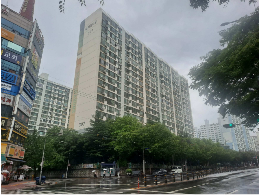
대상물건 남서측에서 촬영