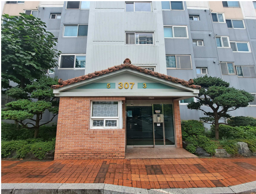
대상물건 북측에서 촬영