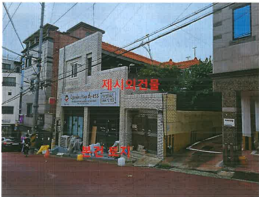
본건 토지 남동측 근경