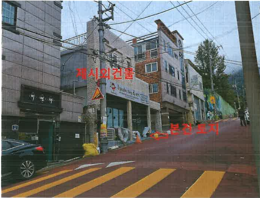
본건 토지 남서측 근경