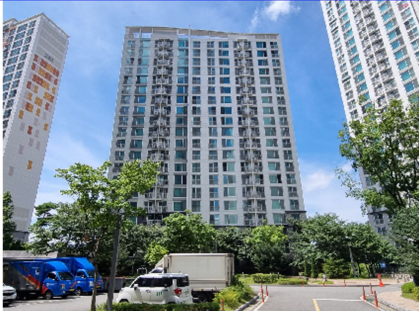
【 본건 전경 】