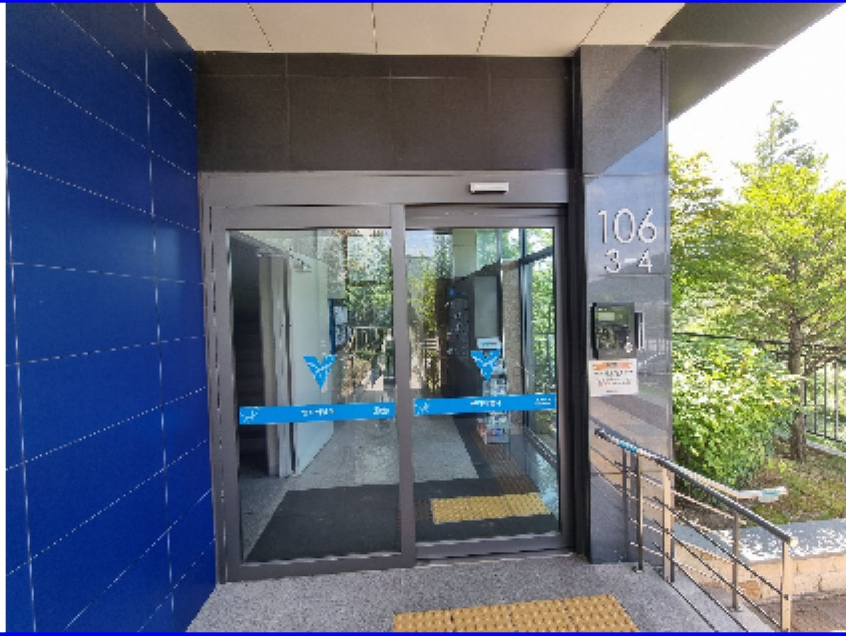
【 본건(출입구) 】