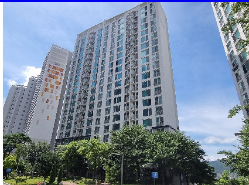
【 본건(106동) 】