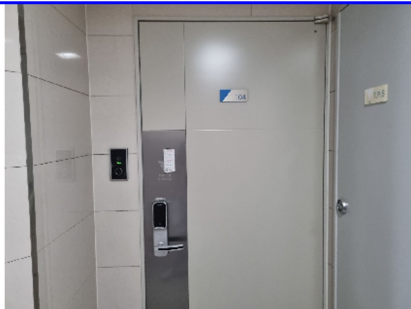
【 본건(현관) 】