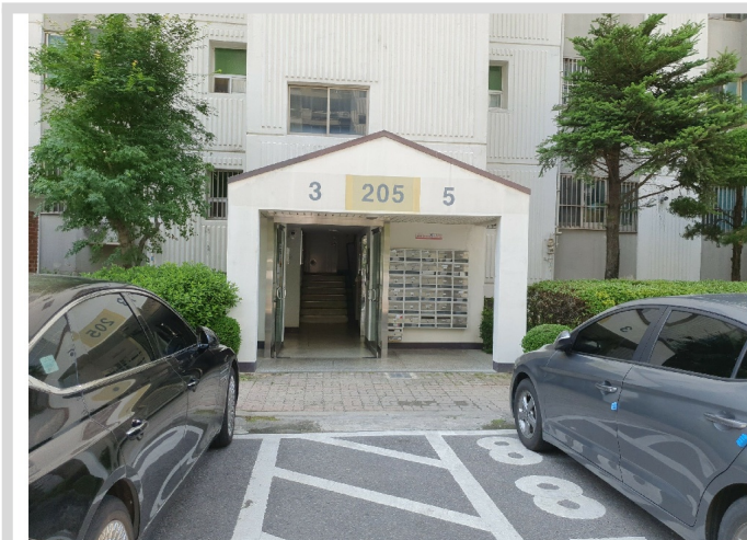
205 3, 5