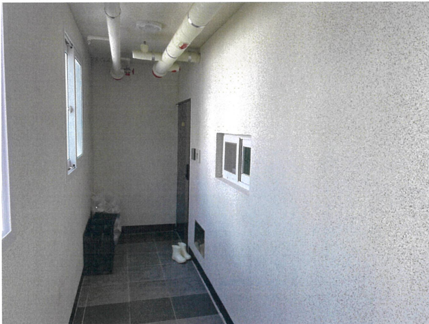
본건 호수 전경