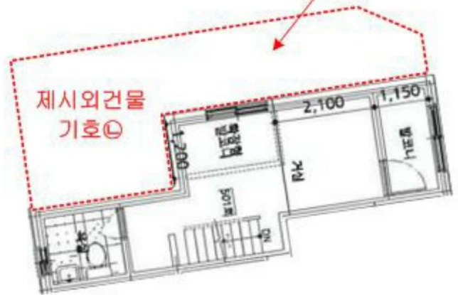
< 본건 제5층 제501호 내부구조도 >