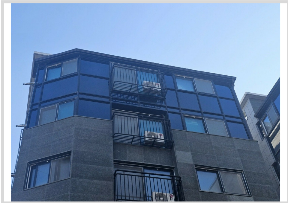
[ , ]