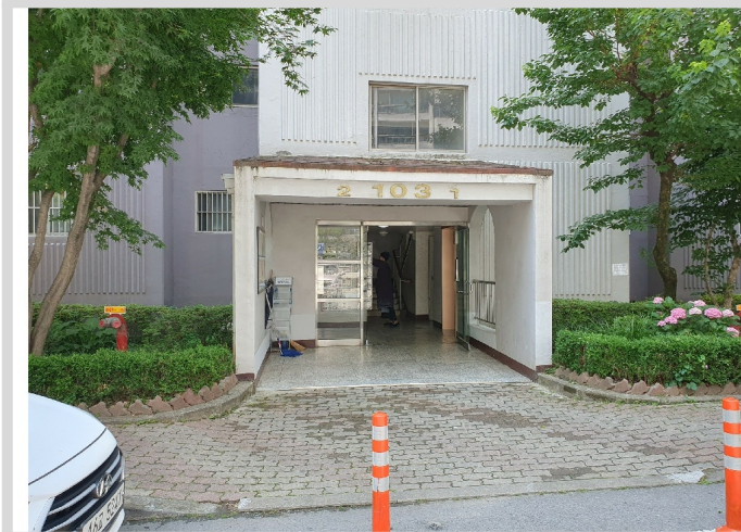
103 1, 2