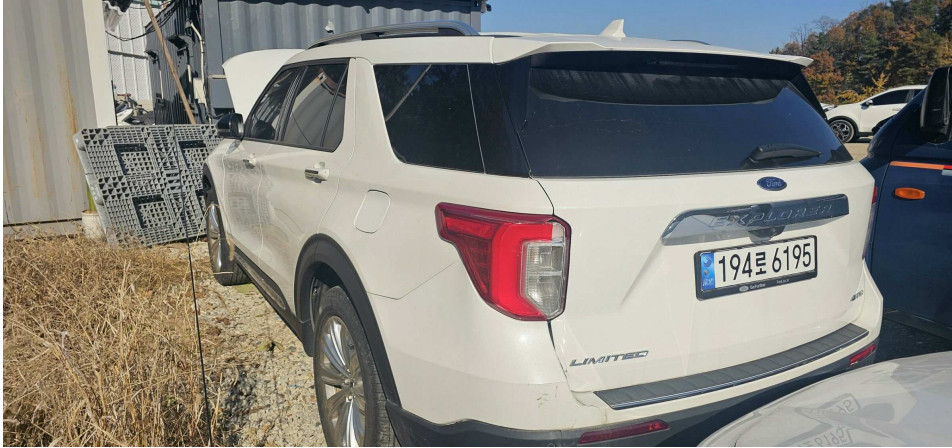
후, 측면 전경