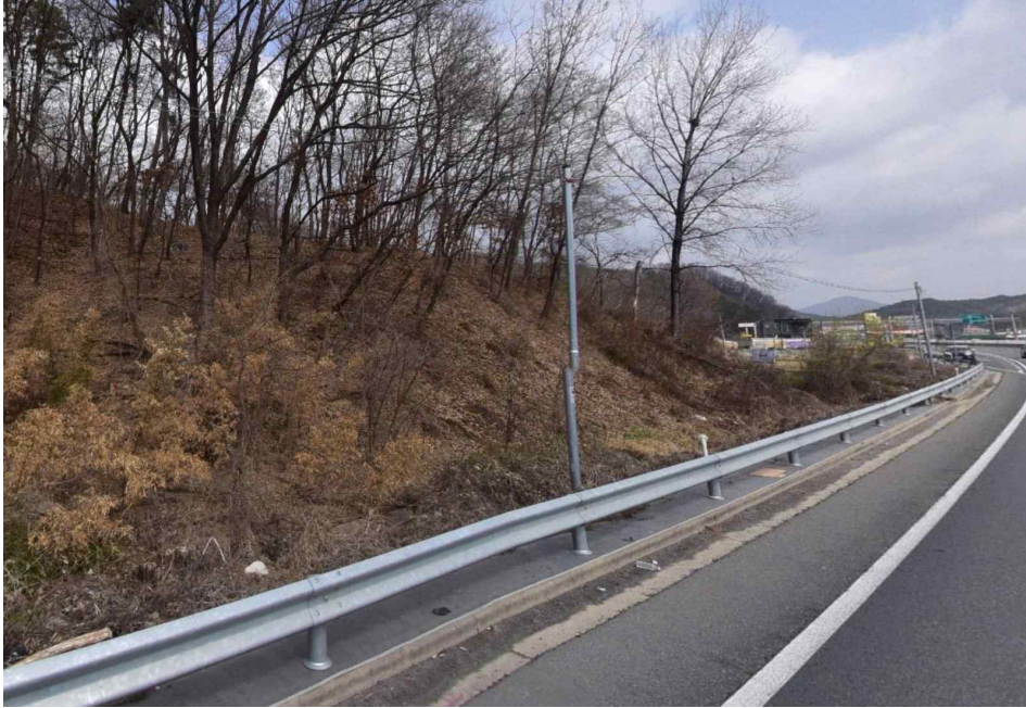
본 건 남 측 전 경