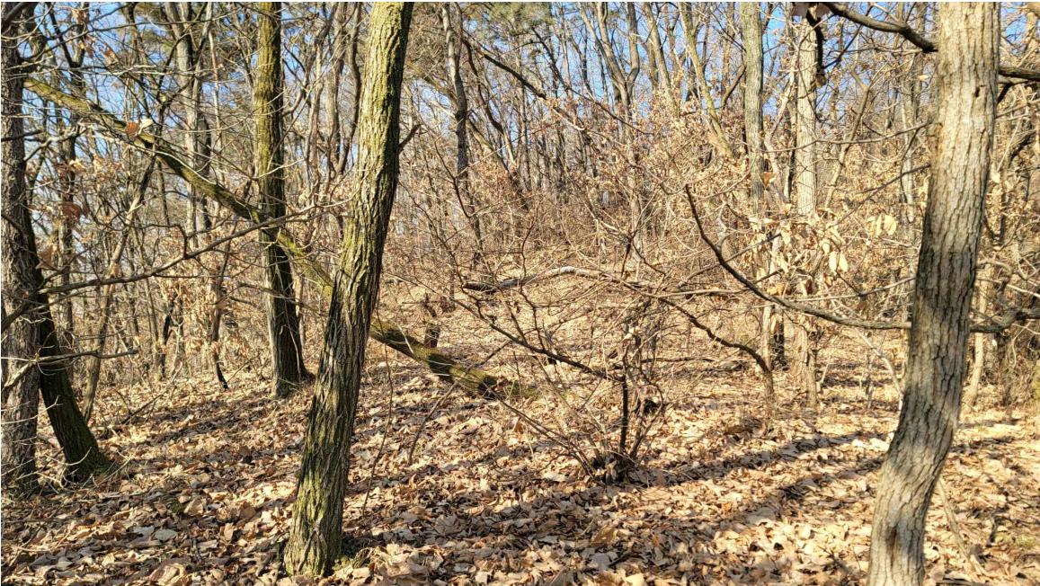
본 건 전 경