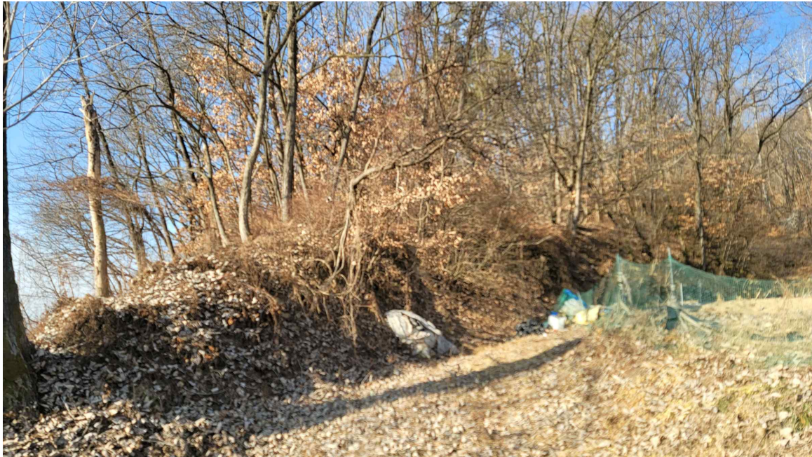
본 건 동 측 전 경