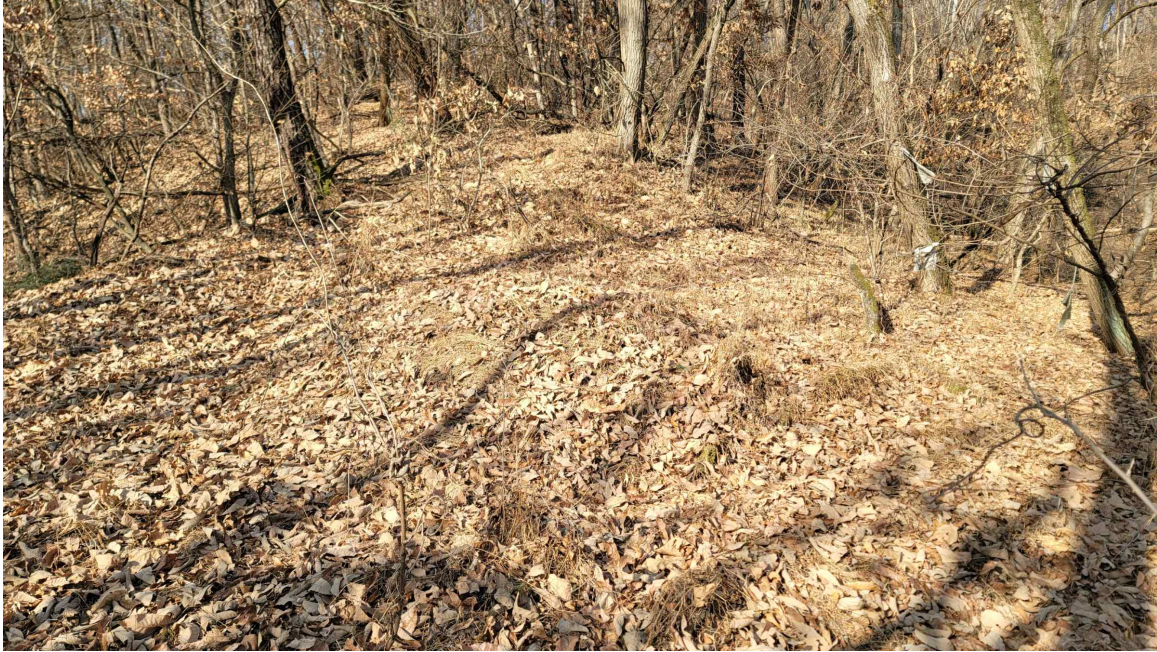
본 건 분 묘 전 경