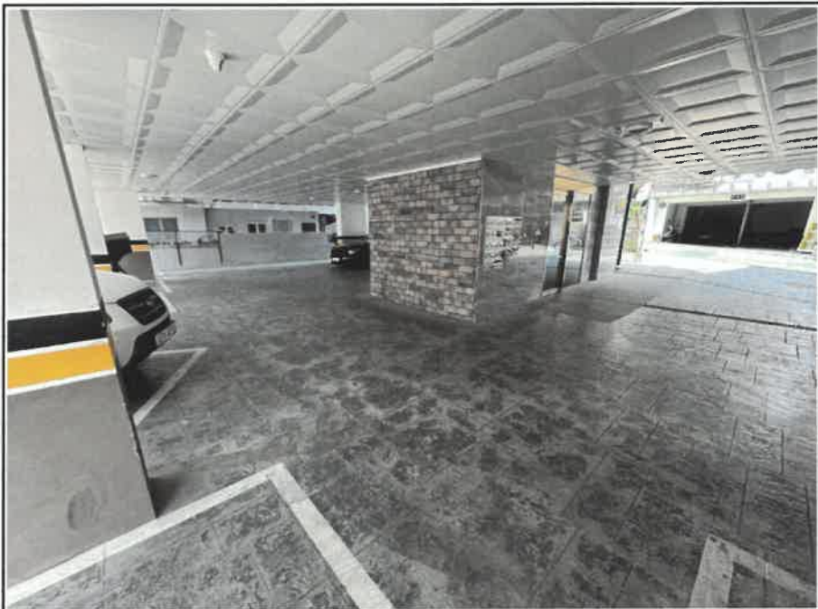
대상물건 건물 주차장