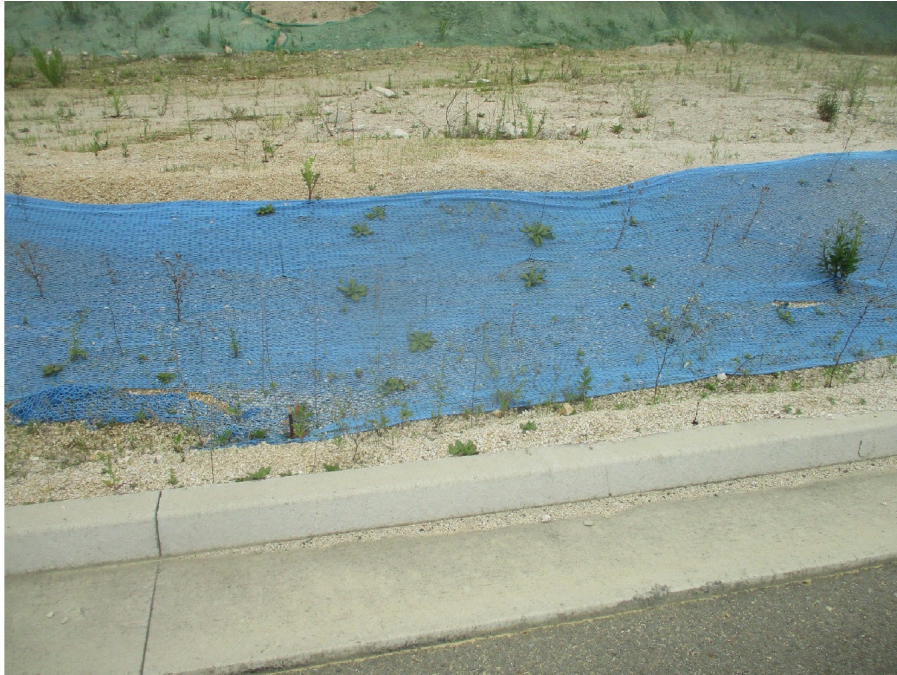
63B 5L ( )