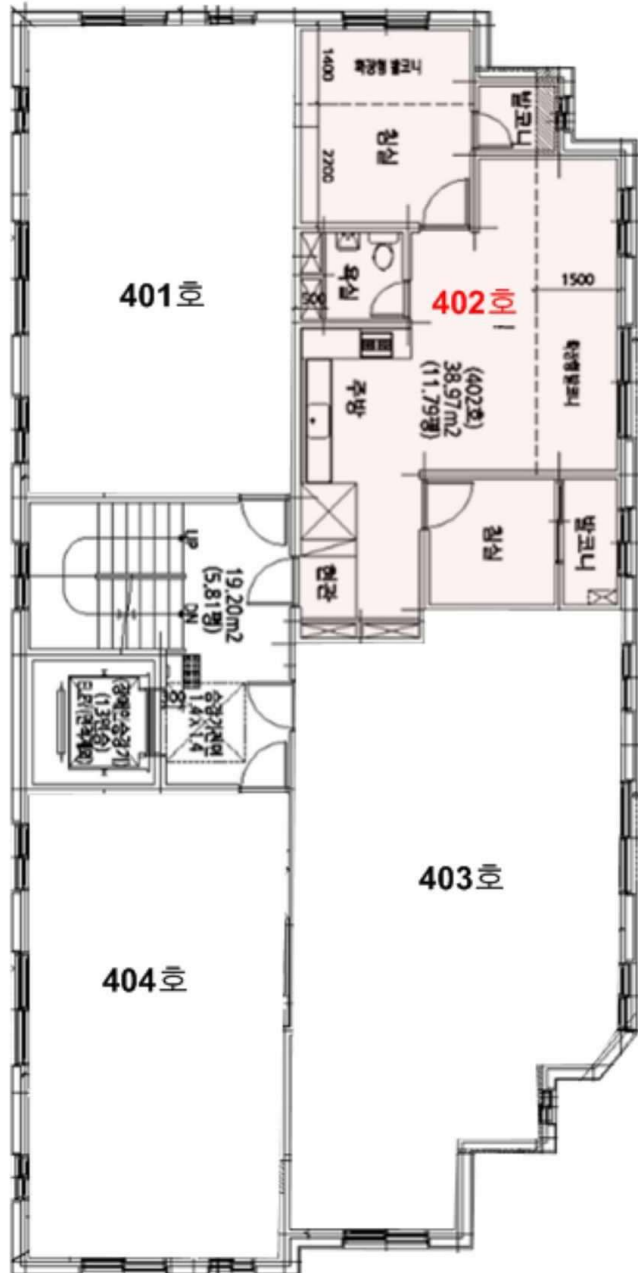
< 프라우드빌 제4층 제402호 호별배치도 및 내부구조도 >