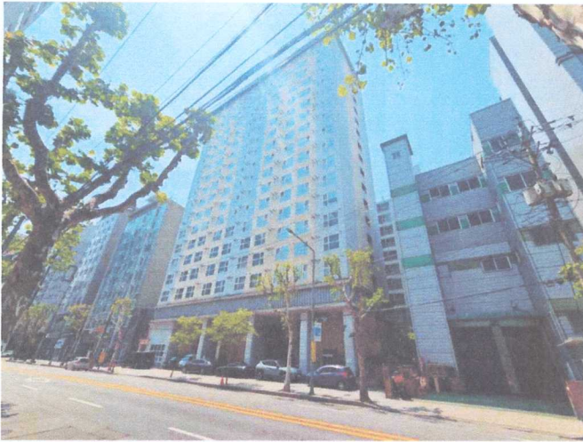
본건 소재 건물 전경