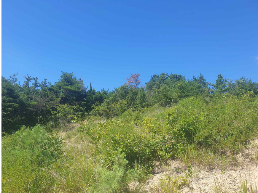
본 건 동 측 전 경