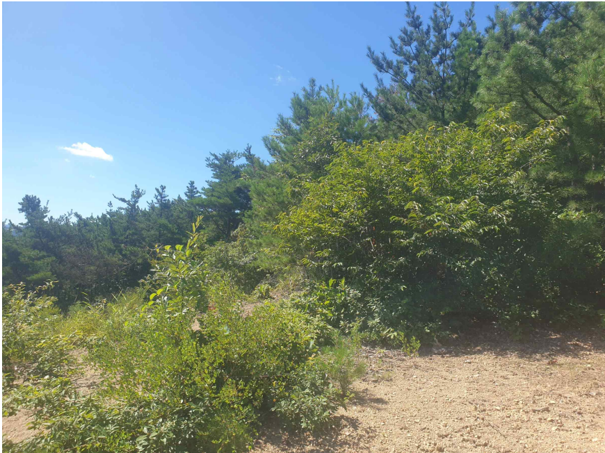
본 건 북 측 전 경