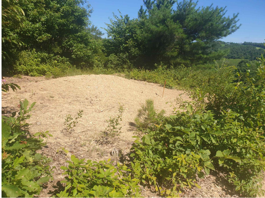
기 호 (1) 지 상 분 묘 전 경