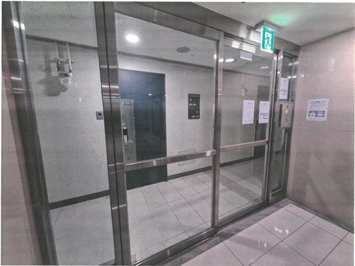
9층 (901호~915호) 출입문