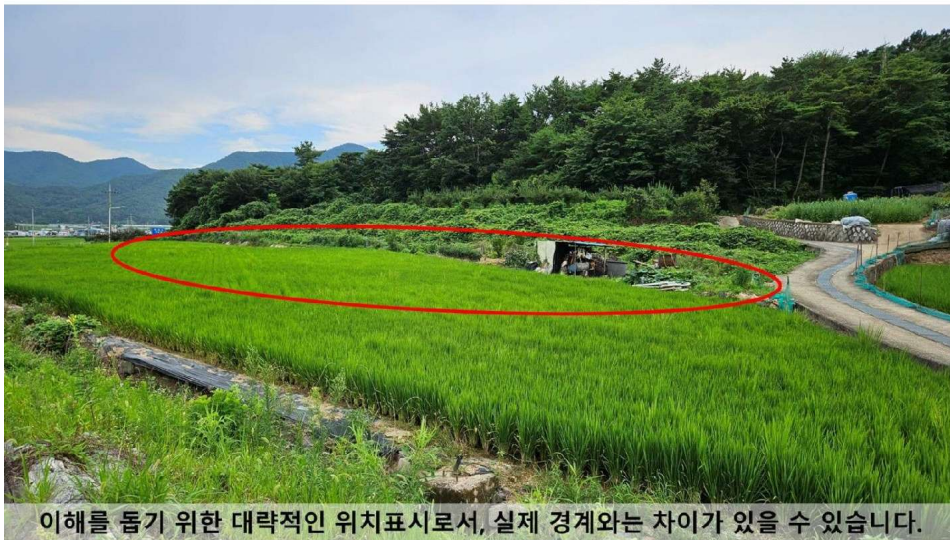
대상물건 북측→남측 원경