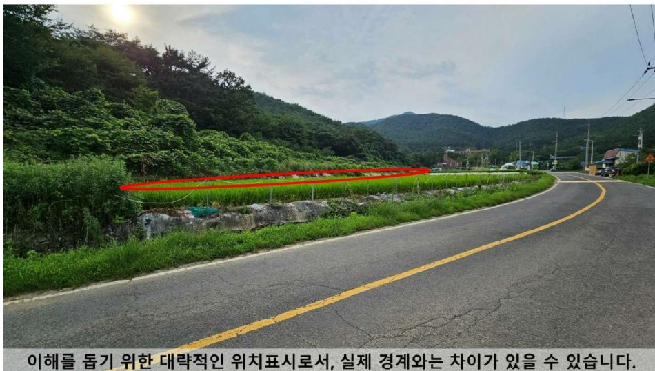
대상물건 남동측→북서측 원경