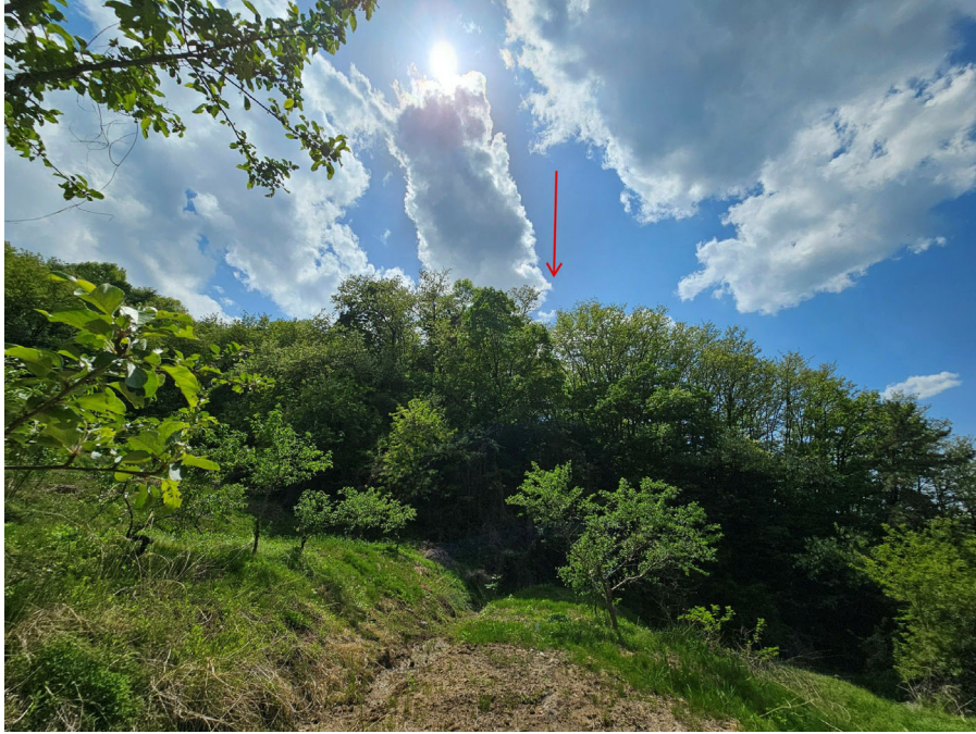
본건 및 주위환경(동측에서 촬영)