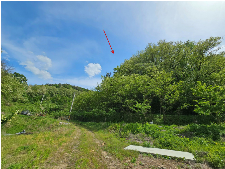
본건 및 주위환경(북동측에서 촬영)