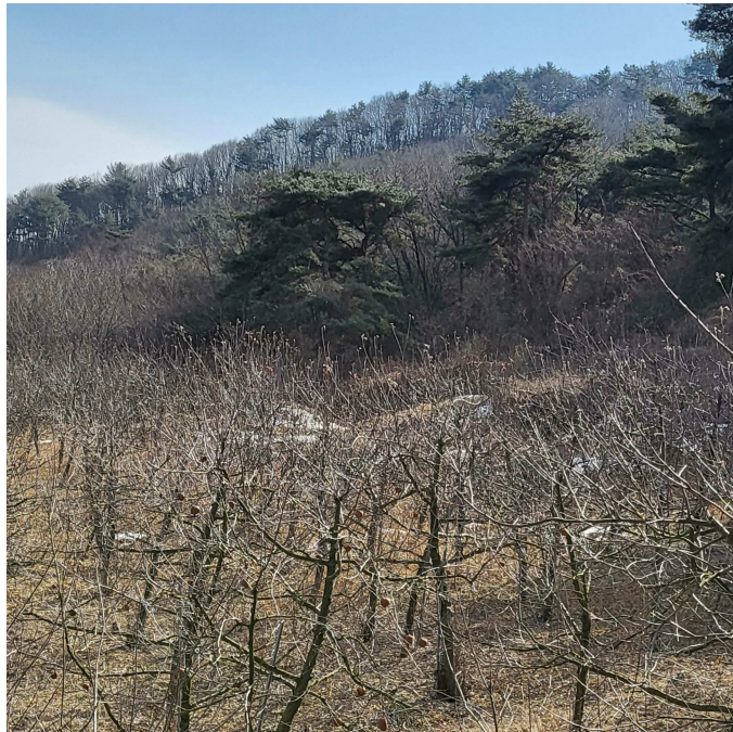
본건 북동측 전경