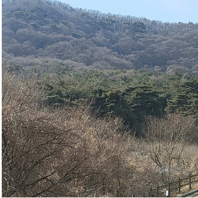
본건 남동측 전경