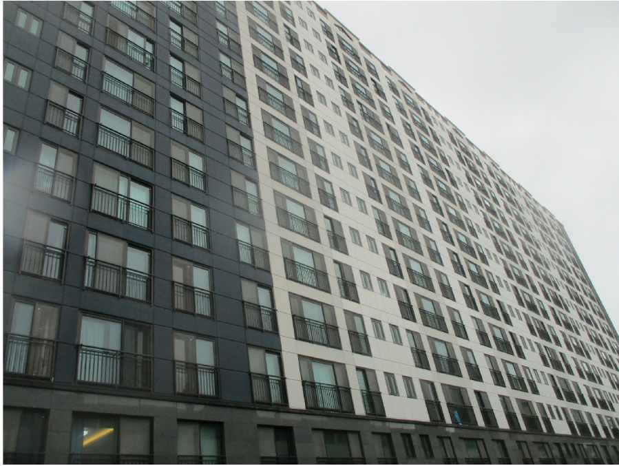
3 ( )