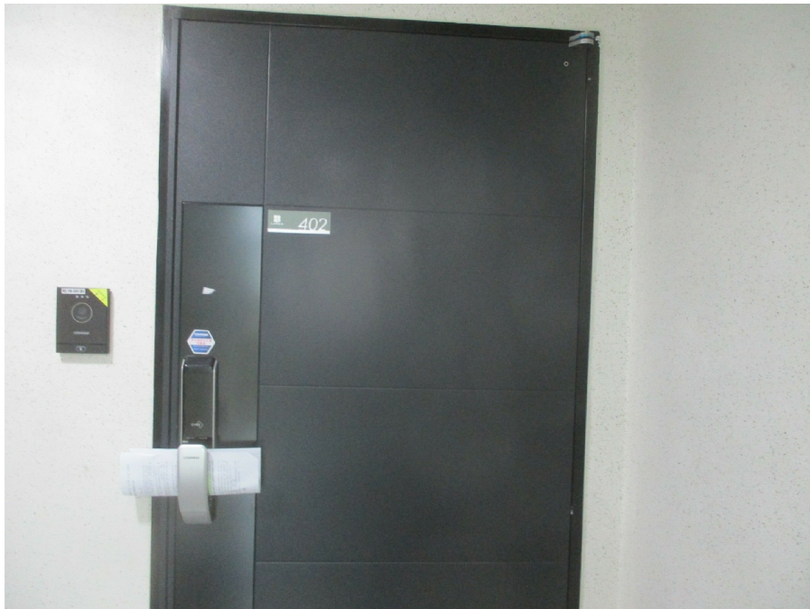
3 4 402