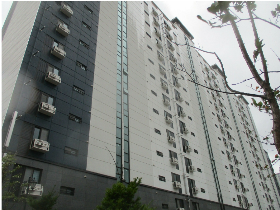
3 ( )