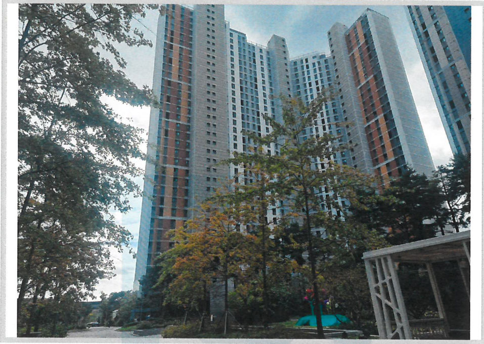
본건 전경(북서측에서 촬영)