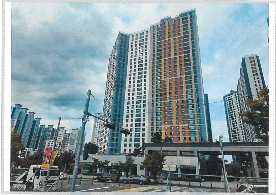
본건 전경(북동측에서 촬영)