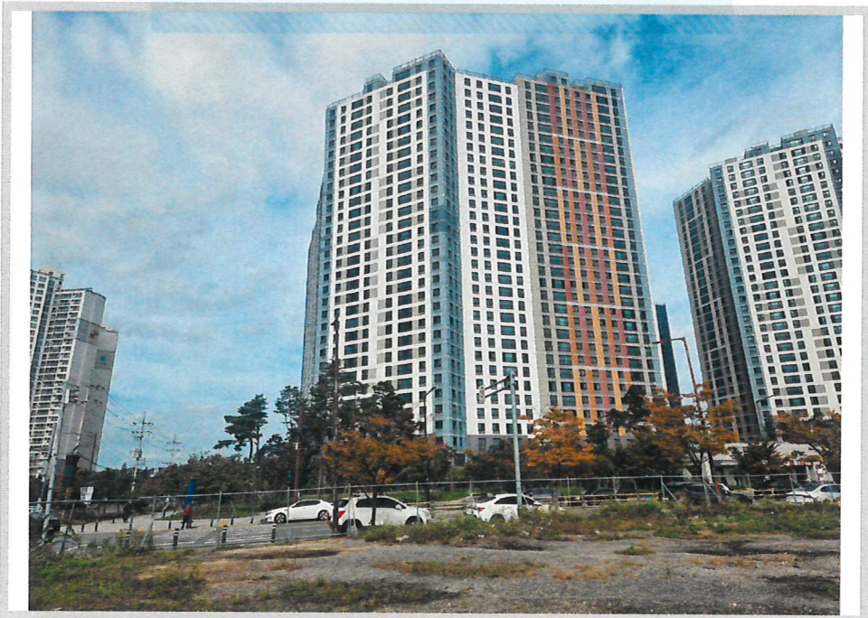
본건 전경(남동측에서 촬영)