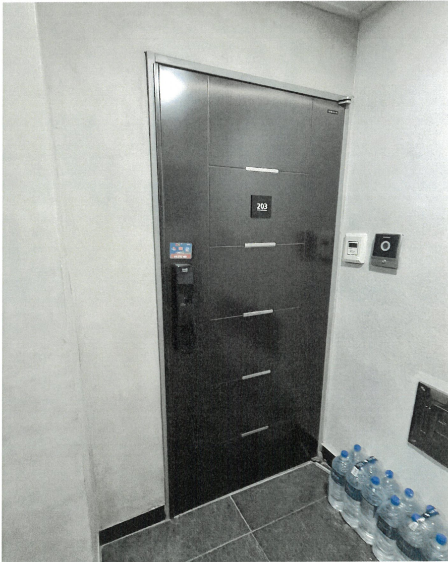
<본건 현관 전경>