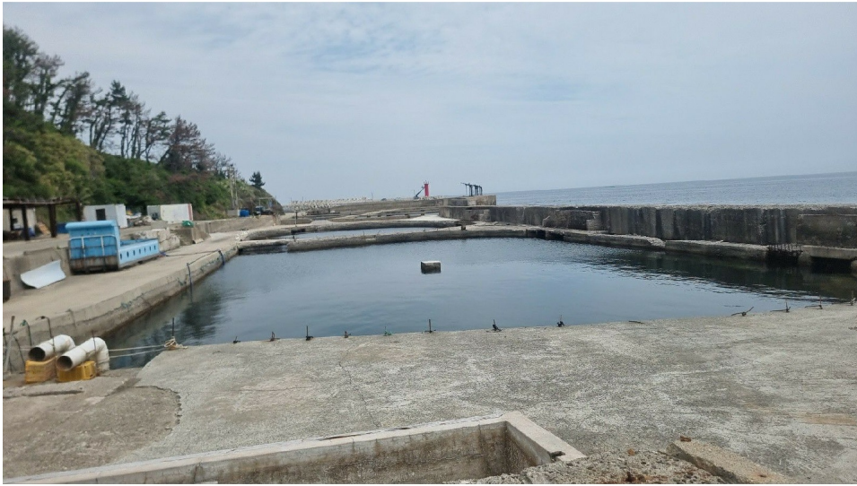
[ ( ) ]