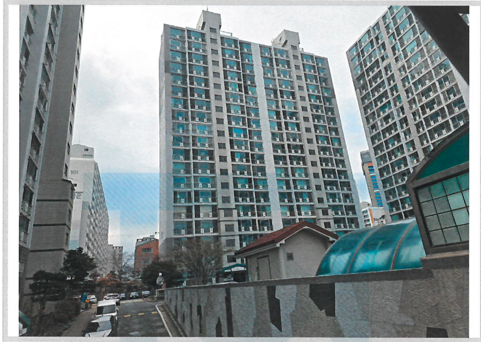
본건 전경(남동측에서 촬영)