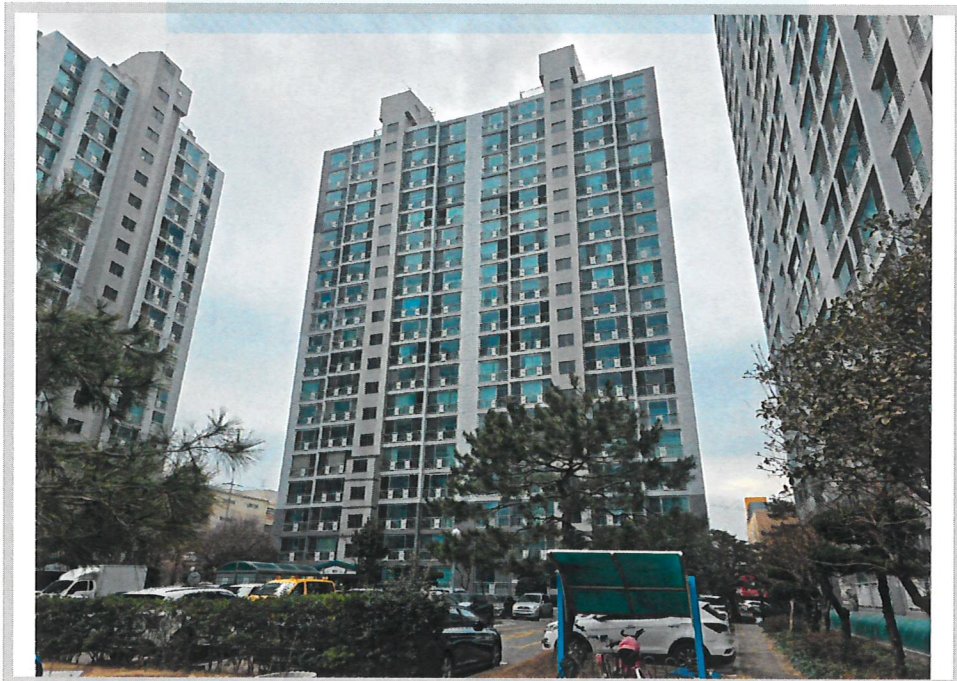
본건 전경(북동측에서 촬영)