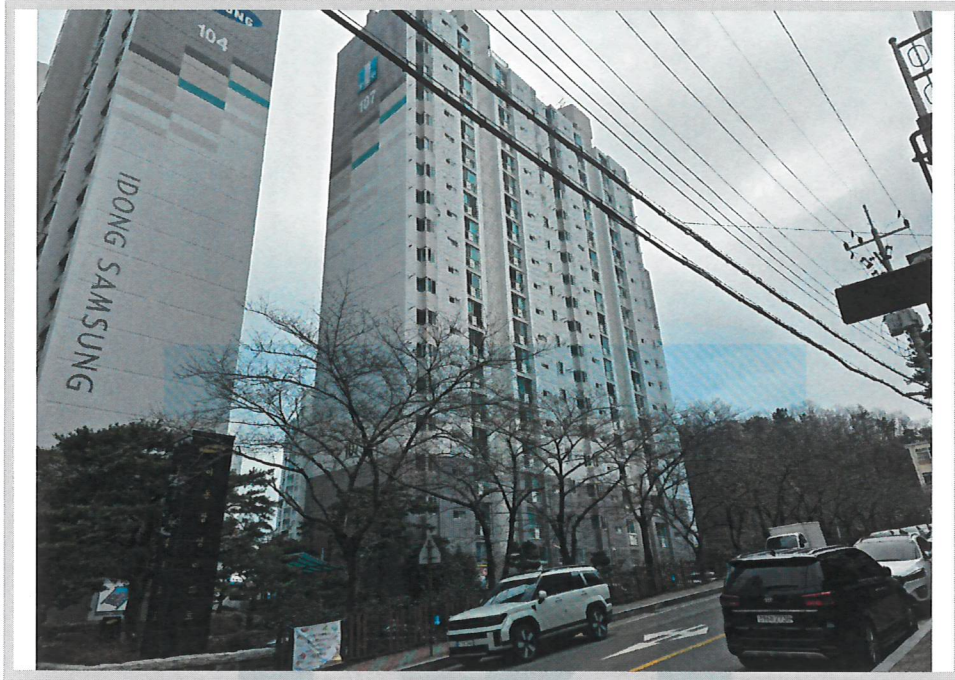
본건 전경(북서측에서 촬영)