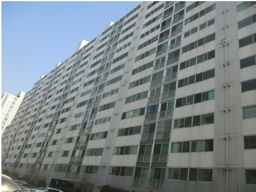
102 ( )