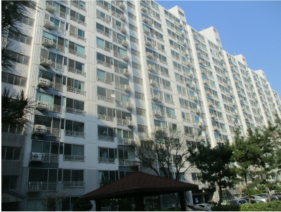
102 ( )