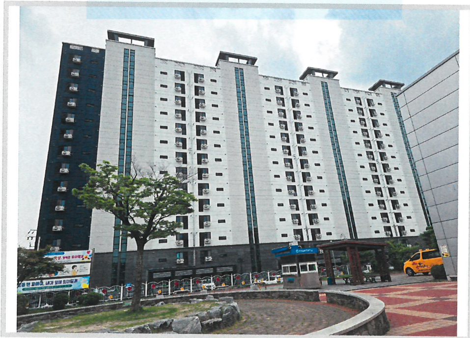
본건 전경(북동측에서 촬영)