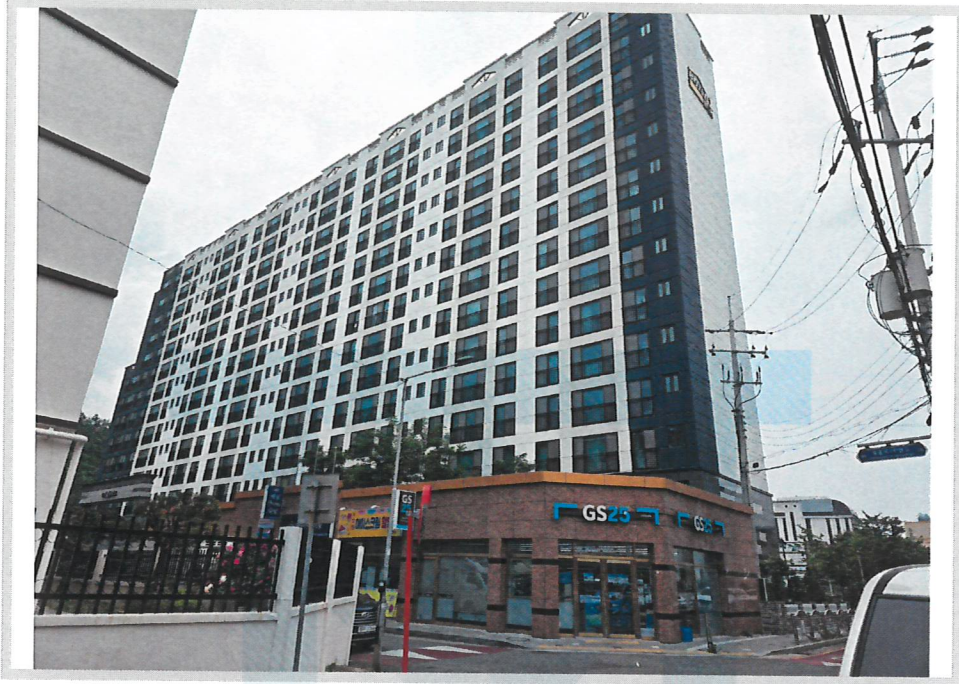
본건 전경(남동측에서 촬영)