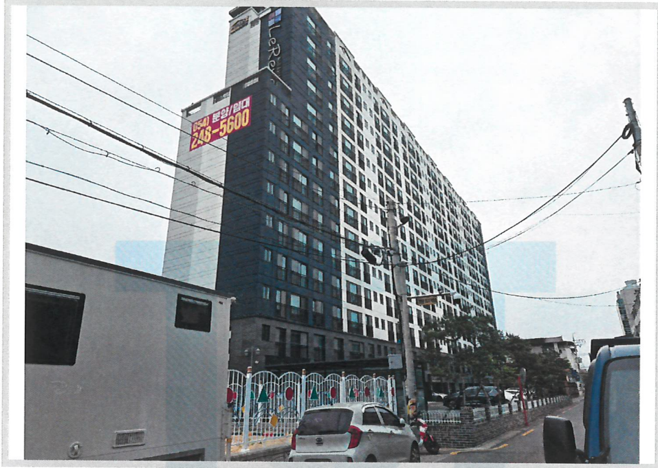
본건 전경(남서측에서 촬영)