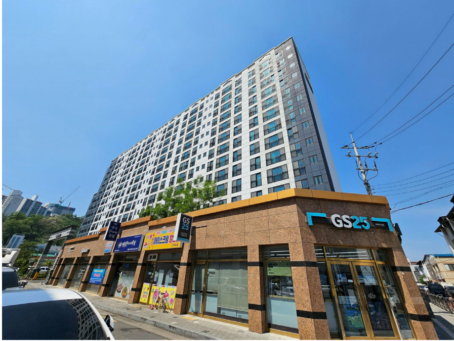
본건동 전경(남동측에서 촬영)