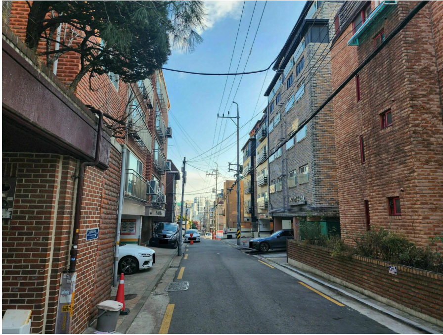
본건 및 주변환경