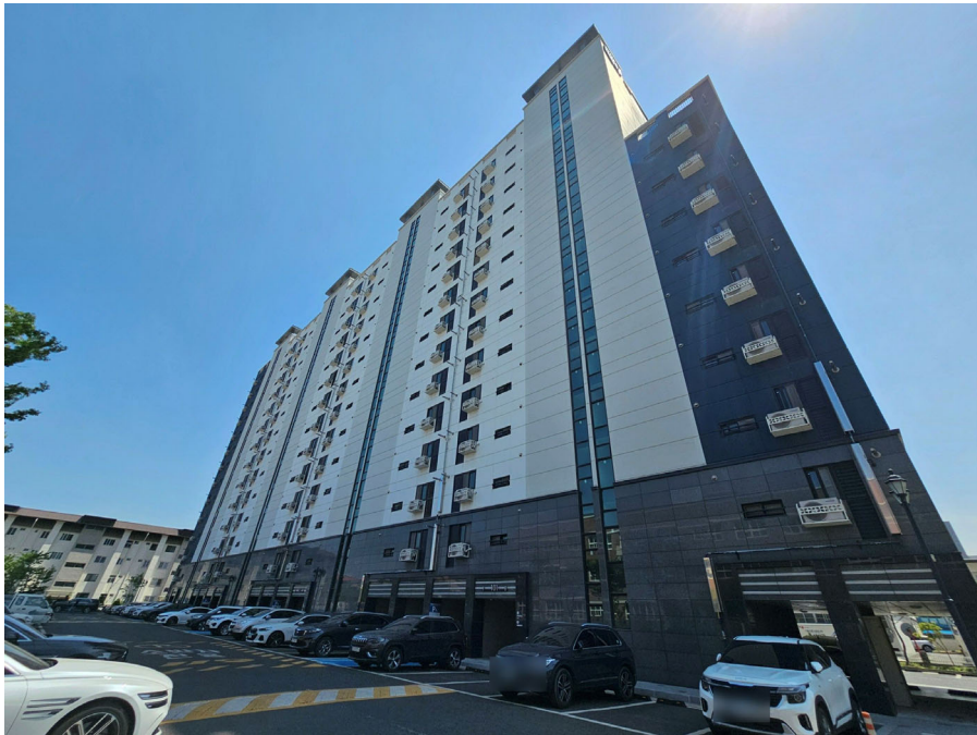
본건동 전경(북서측에서 촬영)