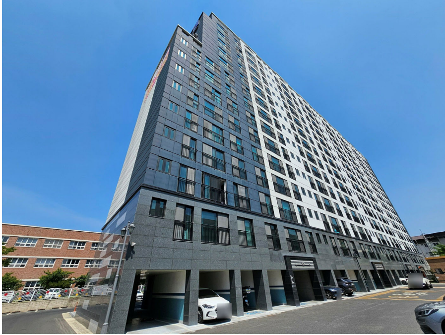
본건동 전경(남서측에서 촬영)