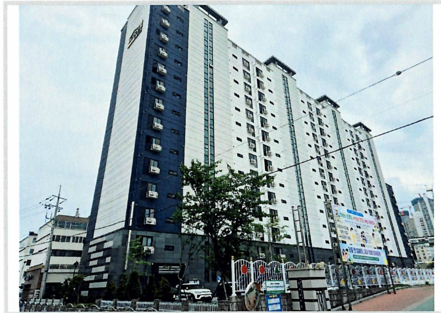
본건동 전경(북동측에서 촬영)