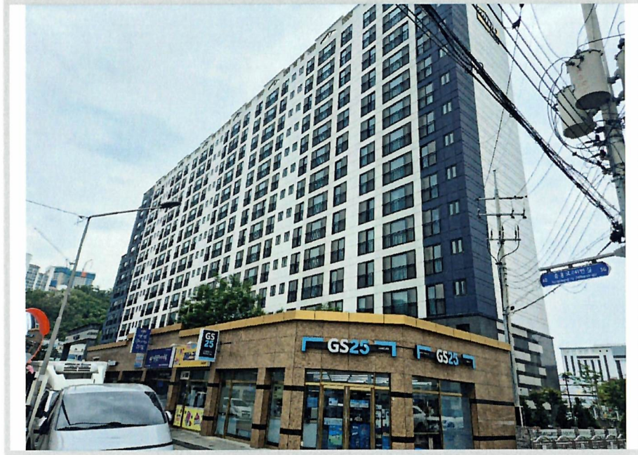
본건동 전경(남동측에서 촬영)