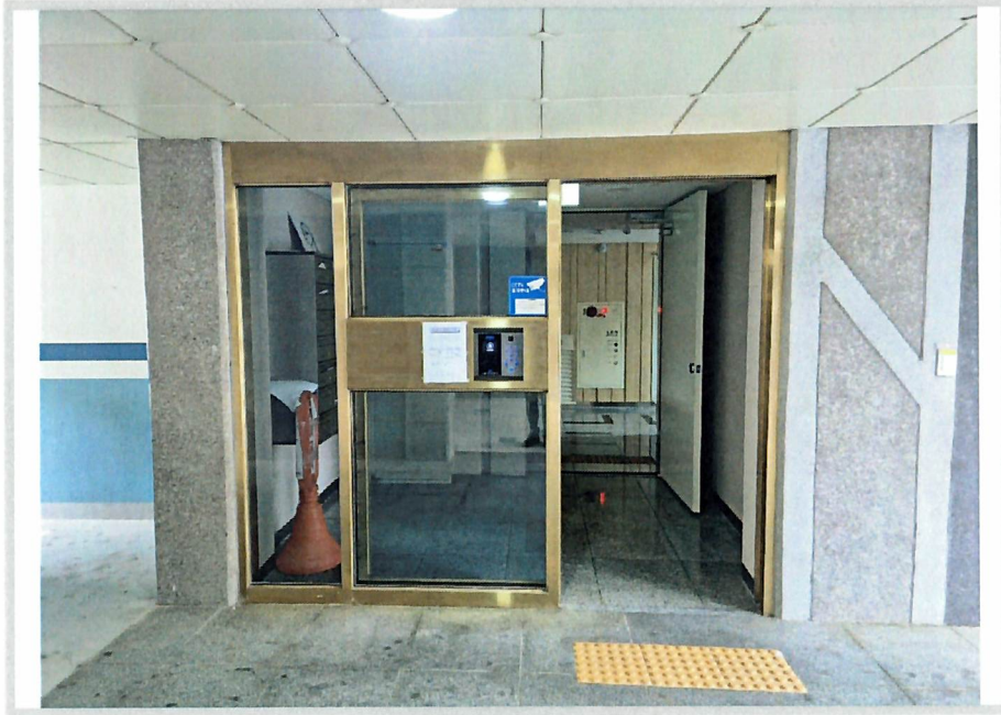
1층 출입문 전경