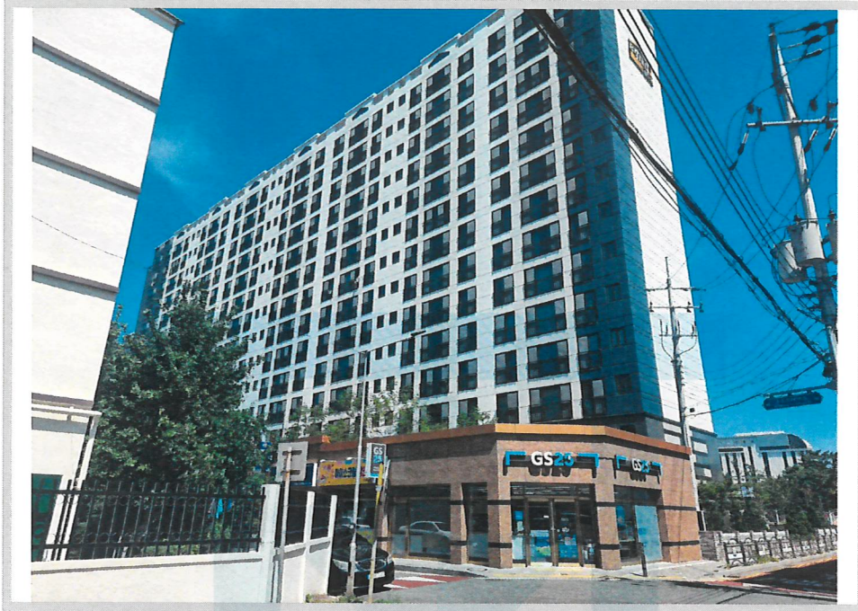
본건 전경(남동측에서 촬영)