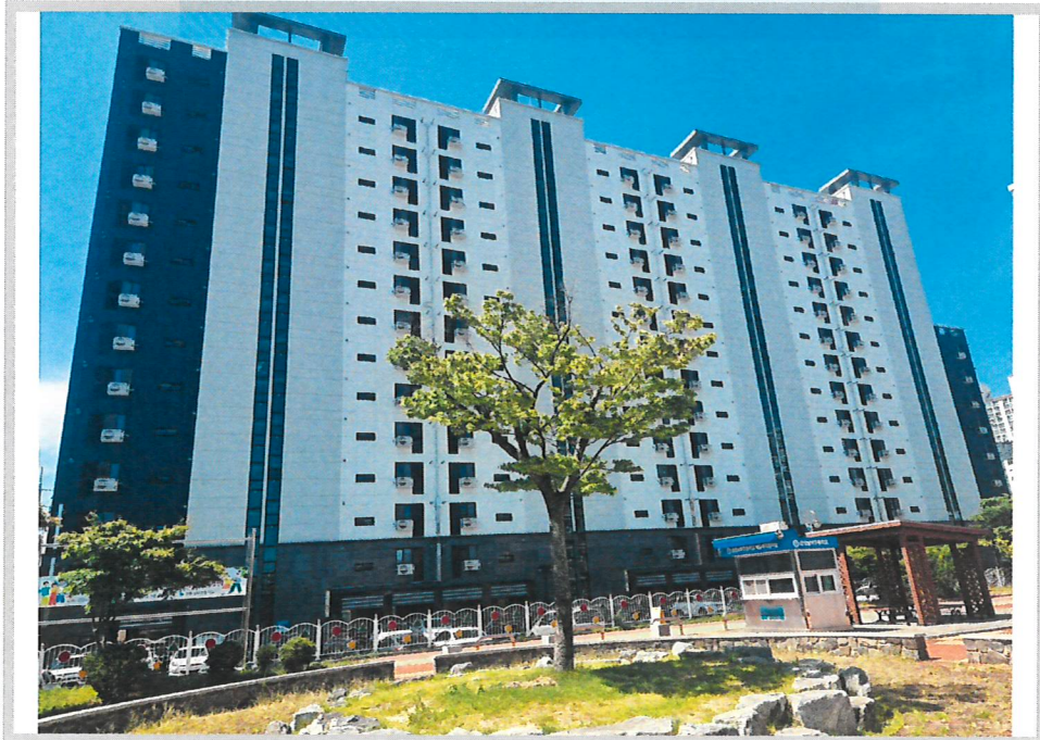
본건 전경(북동측에서 촬영)