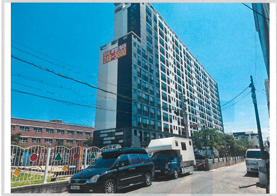
본건 전경(남서측에서 촬영)